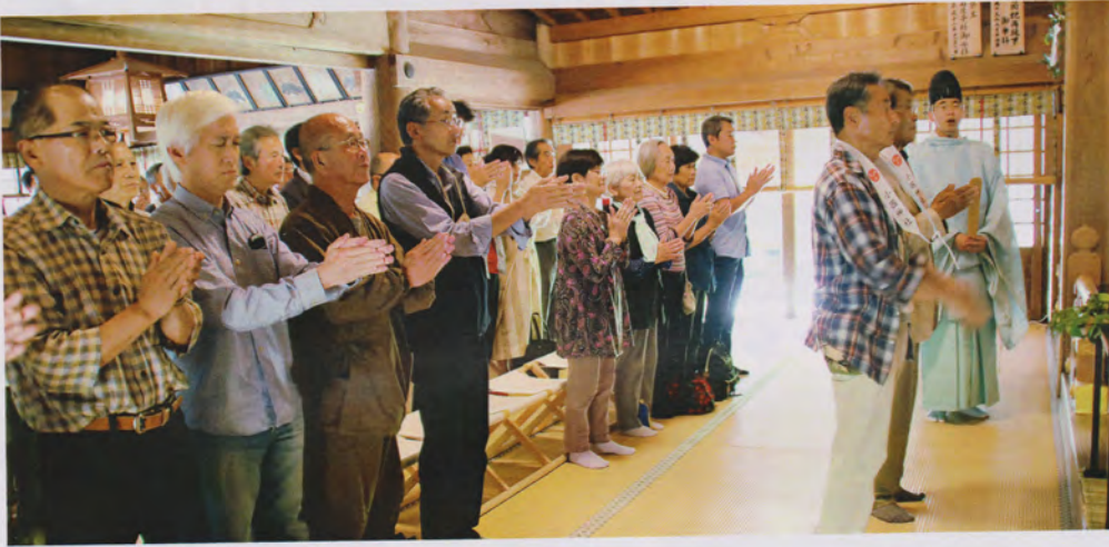
小國神社の本殿にて参加者の健康とめだかの学校開校100回記念大同窓会の盛会を祈念して玉串奉奠。二礼二拍手一礼する。