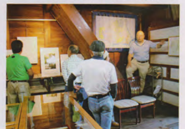
最後は半夏生の群生地へ〜花の力は凄〜(明倫寺)