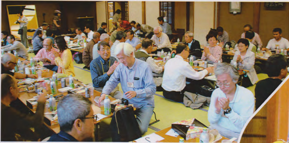
ひ野走か・いっはしへ焼いたホ-ツクの大ホテ 最高!!